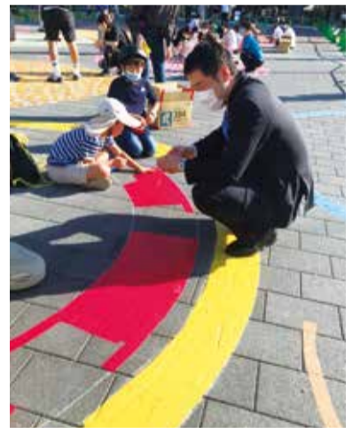
↑子供たちとの触れ合い