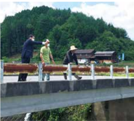
↑地元豊栄の椋梨川視察