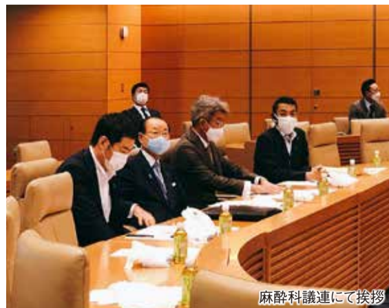
麻酔科議運にて挨拶

新たな総合経済対策に伴う補正予算案など、さまざまな重要政策の決定に尽力いたしました。また、食糧安全保障にも取り組んでまいりました。先行きの見えない世界情勢の中、食料の価格高騰や供給の不安定化により、食料を輸入に依存するわが国は危機に直面しています。食料の安定的な供給を維持するには、日本の農林水産業の持続的な成長が重要だと考えます。10月には、自民党農林部会等で高騰する肥料の調達をはじめ、食の安全に直結する課題への対応を求めてまいりました。その結果、10月末に取りまとめられた総合経済対策には、海外依存度の高い肥料や飼料、大豆、小麦等の国内生産の拡大を含む、食料品供給体制の強化が盛り込まれました。今後、農林水産業を生業とされる皆さまが、安心して生産に取り組め