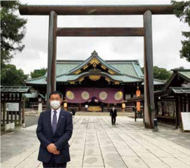
↑靖国神社を参拝する国会議員の会の一員として