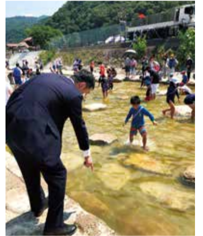
↑鮎のつかみ取りをする子供たちと