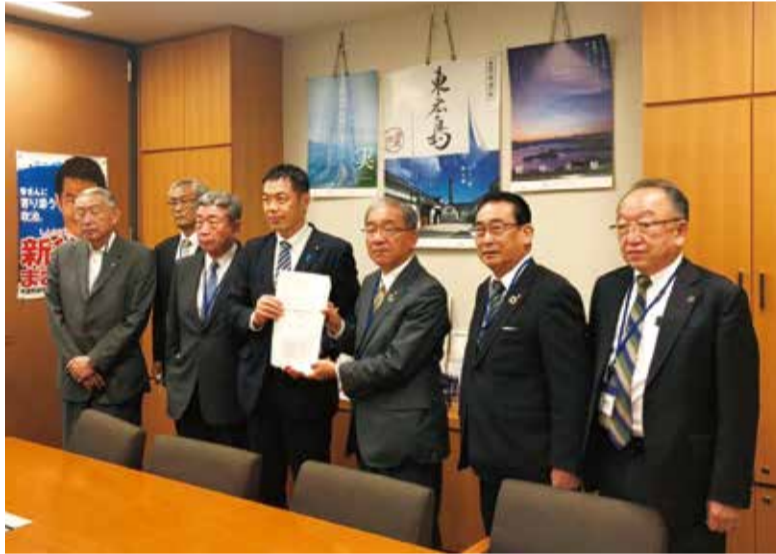
↑地元の市長・町長から中国地方道路に関する説明および決議書の受け取り