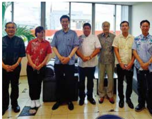
↑沖縄企業懇談会にて 沖縄担当党副幹事長(当時)として