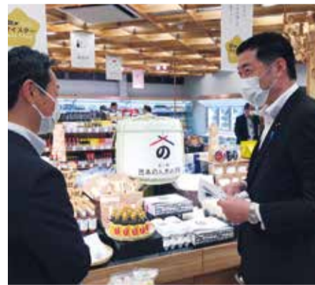
↑道の駅西条のん太の酒蔵にて