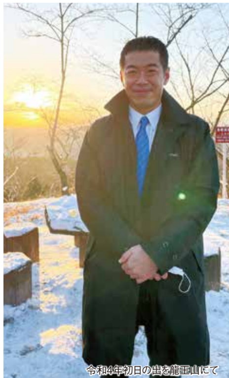
令和4年初日の出を龍王山にて

10月に開会した臨時国会では、議院運営委員会理事・国会対策副委員長として、感染症法の改正案や、