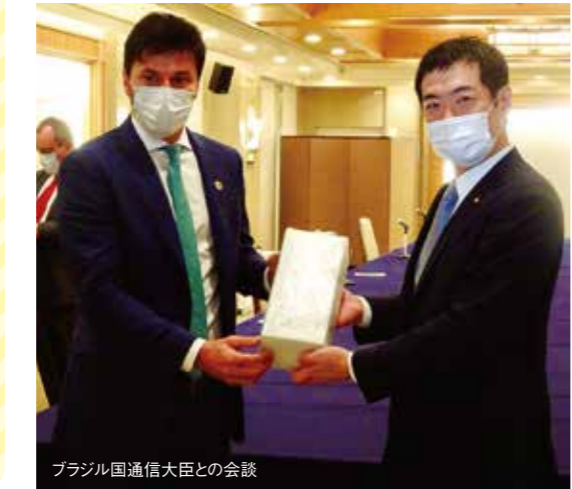
ブラジル国通信大臣との会談

現してきました。こうした取り組みは、岸田政権が進めているデジタル田園都市構想の基盤となるものです。引き続き、岸田内閣とも連携したデジタル化のための取組の推進が求められます。