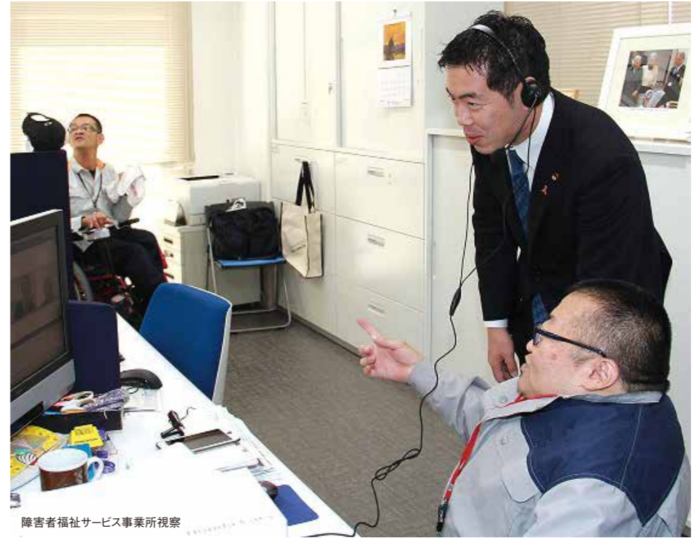
障害者福祉サービス事業所視察

新谷代議士は勤め上げた三期の中で衆議院議員として様々な活動に取り組んできましたが、特に厚生労働大臣政務官、そして総務副大臣として、政府の中で大きな仕事に取り組んできたことが印象的