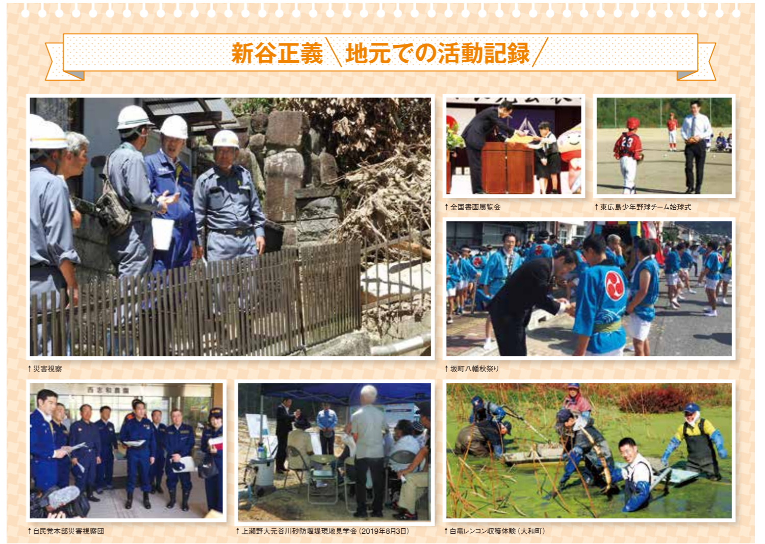
↑ 全国書画展覧会 ↑ 東広島少年野球チーム始球式 ↑ 災害視察 ↑ 坂町八幡秋祭り ↑ 自民党本部災害視察団 ↑ 上瀬野大元谷川砂防堰堤現地見学会（2019年8月3日） ↑ 白竜レンコン収穫体験（大和町）

のと確信しております。 そして本年は、自由民主党 総裁選挙におきまして、岸田 文雄新総裁が選出されまし た。広島からの総理大臣は実 に30年ぶりの選出でありま す。新谷正義は同じ広島国会 議員として、岸田総理との 距離も近く、本政権におい ても、大いに活躍してくれ ると思っております。 これからも新谷正義が国の 為に先頭に立ち、国民と地元 の為に力を尽くすことを期待 するとともに、後援会として も地元の課題や意見を新谷代 議士に伝え、郷土をよりよく 発展させるために活動してま いります。 さてこの度、新谷正義は自 由民主党副幹事長に就任いた しました。自民党には日々、全 国各地様々な要望や報告が参 りますが、そのほぼ全てが幹 事長室に集約されます。この ように幹事長室の仕事は、党 として取り組む重要課題への 対応そのものであり、各省庁 にも強い影響力を持つことに なります。副幹事長は幹事長 のもと、こうした重要課題に 対する解決策を検討し、皆さ んの生活を一層発展させるた めに日夜奔走しております。